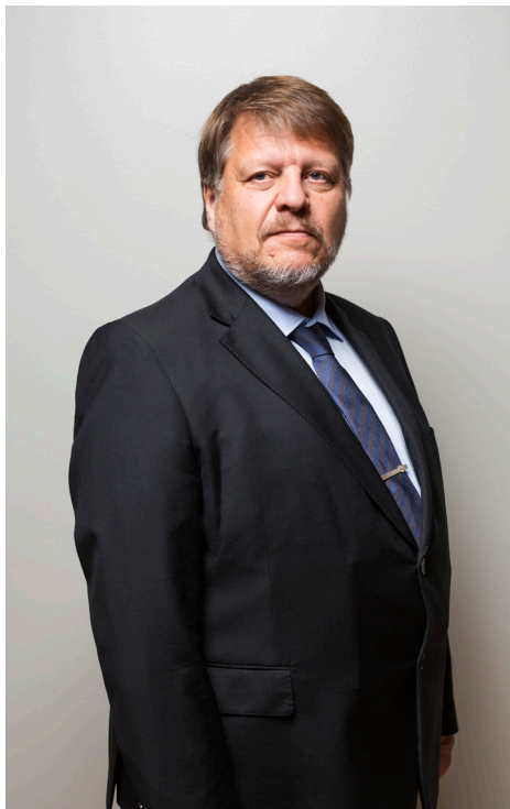
Kimmo Hakonen tiedusteluvalvontavaltuutettu