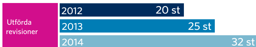
Figur 2: Antalet revisioner som revisionsverket har gjort 2012–2014

Nio riksdagspartier och deras 23 distriktsorganisationer var föremål för granskning av partifinansieringen. Sammanlagt genomfördes 32 granskningar, jämfört med 25 år 2013 och 20 år 2012. Tillsynsobjekten underrättades om granskningarna i maj 2014, tillsynsobjekten lämnade in det begärda förhandsmaterialet till revisionsverket i huvudsak före granskningarna och granskningarna utfördes i enlighet med granskningsplanen i september-oktober 2014. På grund av valdistriktsförändringarna riktades begäranden om upplysningar samt granskningar samtidigt även till distriktsorganisationer som fått statsunderstöd men som senare lagts ned eller som senare lagt ned sin verksamhet.