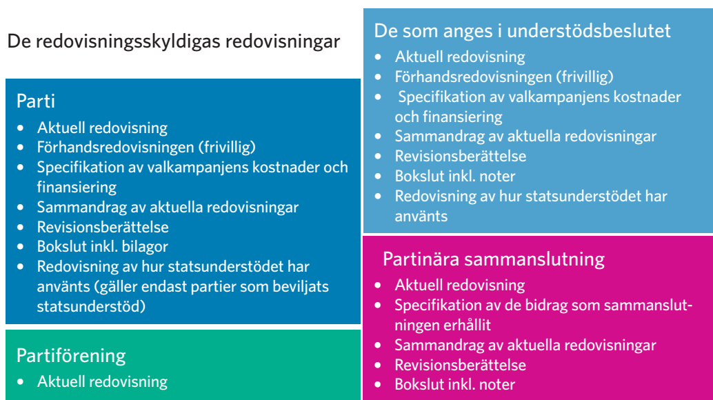
Figur 1: Redovisningsskyldiga och deras redovisningar enligt partilagen

I partilagen har föreskrivits om lämnande av olika uppgifter till statens revisionsverk. I det följande behandlas vilka uppgifter som ska lämnas till revisionsverket och vilken instans som är skyldig att lämna dessa uppgifter.